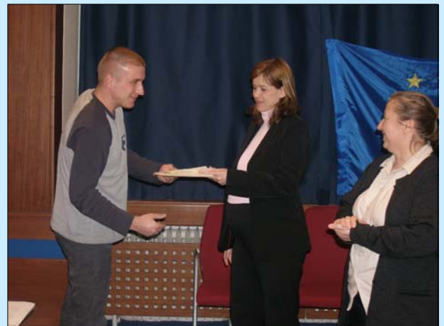
Dodjela certifikata trenerima