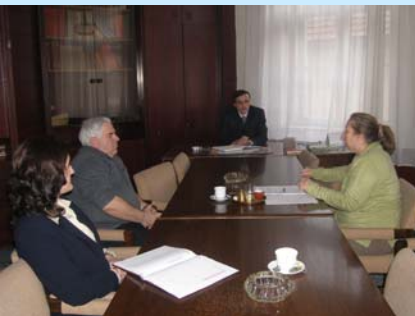
Sastanak sa Načelnikom općine Fojnica