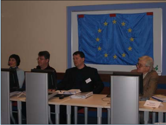
TOT (trening za trenere)

prezentirala je vještine vođenja radionice. Treneri su prošli i praktičnu obuku softverskog paketa Power Point.